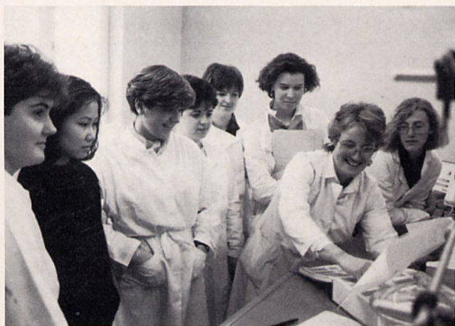
Partner-Schülerinnen aus Straßburg vergleichen und identifizieren während eines Praktikums im Institut ein im Experiment gefundenes Spektrum («Fingerabdruck» der Substanz) mit Spektren einer umfangreichen Sammlung.

Die gegenseitigen Besuche sind für alle eine Bereicherung; die Partnerschaft hat sich gut eingespielt, ohne zur langweiligen Routine zu werden.