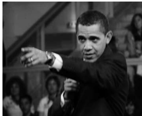
Barack Obama leads the way