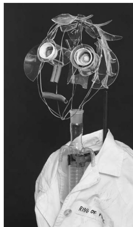
Wie Phoenix aus der Asche: Kunst aus ausgemusterten Laborgeräten